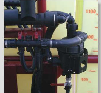
Filtro autolimpiante para evitar paradas innecesarias.