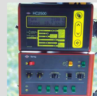
HC 2500 para el control automático de la pulverización.