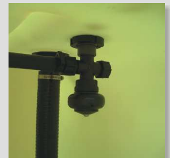
Boquilla giratoria multichorro para el enjuague del depósito.