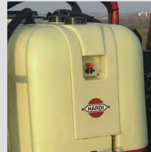
Depósito lavamanos y de enjuagado independientes.

El HARDI Controller 2500 garantiza una máxima precisión y eficacia del tratamiento fitosanitario.