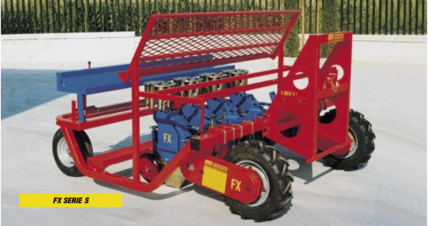
FX SERIE S