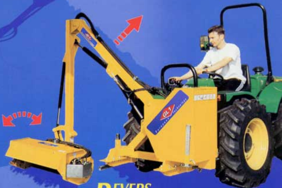
REVERS R 320 - 380