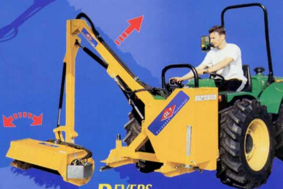
REVERS R 320 - 380