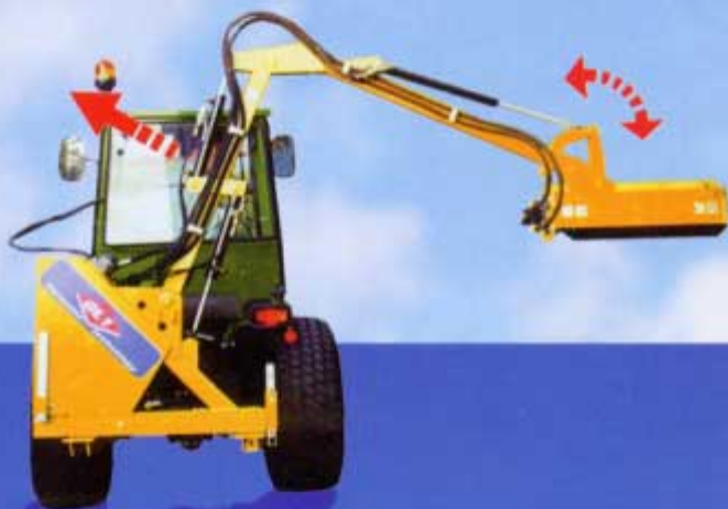
MINIPARK MP 250 - 300