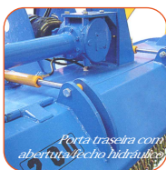
Porta traseira com abertura/fecho hidráulico