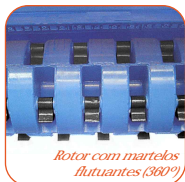
Rotor com martelos flutuantes (360°)