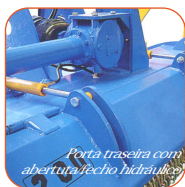
Porta traseira com abertura/fecho hidráulico