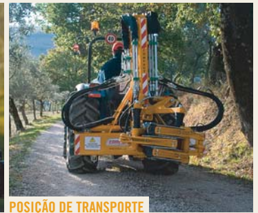
POSIÇÃO DE TRANSPORTE