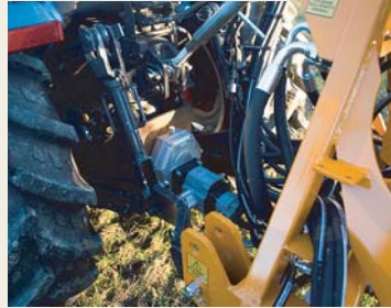
GRUPO BOMBA DE ENGATE À TDF