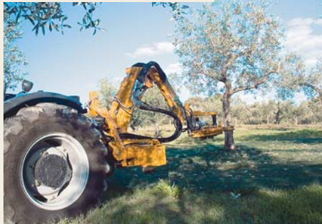
NÃO DANIFICA OS PEQUENOS TRONCOS

Aplicação ligeira, não sobrecarga o tractor e não danifica o terreno