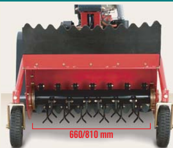
LARGHEZZA DI LAVORO 660/810 mm