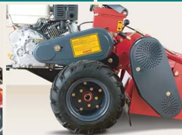
TRASMISSIONE A DOPPIE CINGHIE